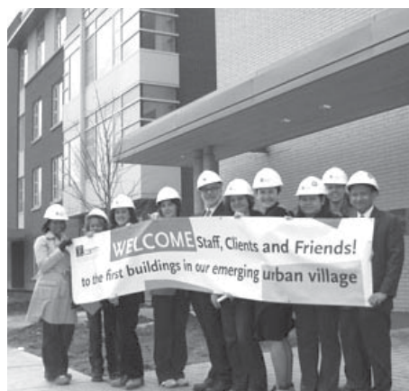
Journée d'ouverture en 2008