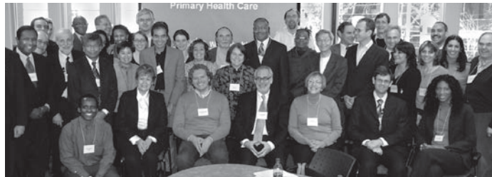
Plus de 40 délégués ont participé à cette réunion internationale.