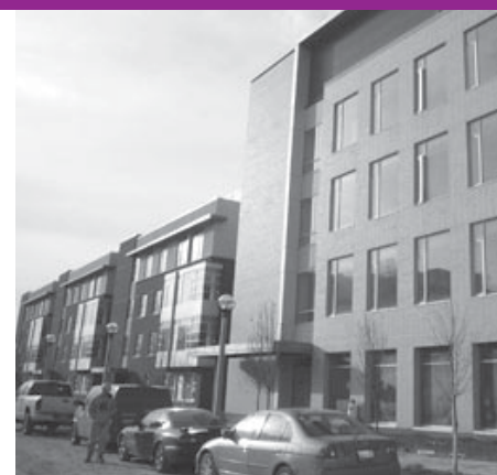
... à janvier 2008